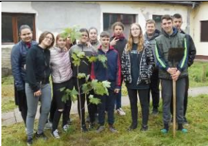
Sadnja drva u okviru akcije početkom maja 2022.

18. Radna akcija – očuvanje životne sredine – maj.