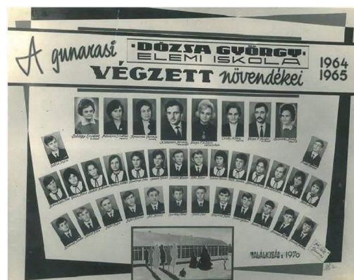
Prva generacija završnog razreda osmogodišnje škole

Nastava za đake počela je od prvog do četvrtog razreda 1882. godine u jednoj zgradi od naboja. 1948. godine škola proširuje rad na šest odeljenja. 1955-56. godine izgrađena je nova školska zgrada, gde se od 1957-58. godine vaspitno-obrazovni rad odvija od prvog do osmog razreda osnovnog obrazovanja. 1970-71. godine izgrađena je fiskulturna sala.