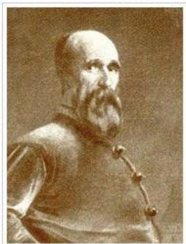
Đerđ Doža (1470-1514)

Vođa paorskog ustanka i heroj u borbi protiv Turaka, škola nosi njegovo ime.