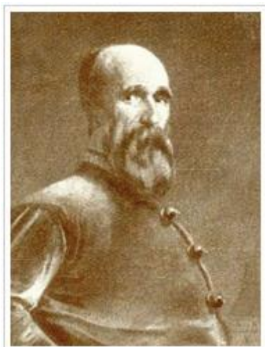
Đerđ Doža (1470-1514)

Vođa paorskog ustankai heroj u borbi protiv turaka, škola nosi njegovo ime.